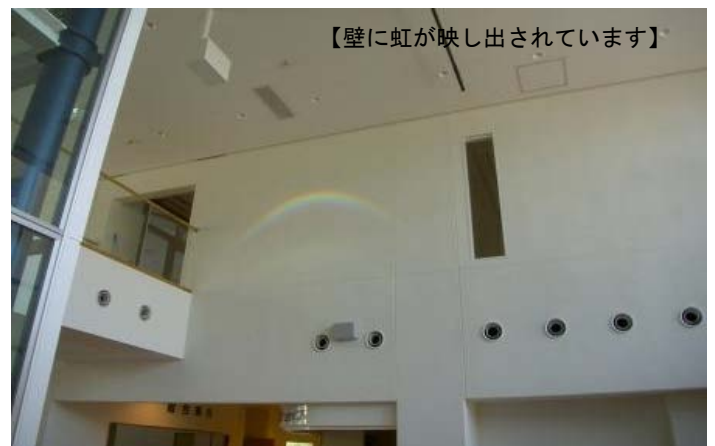
【壁に虹が映し出されています】