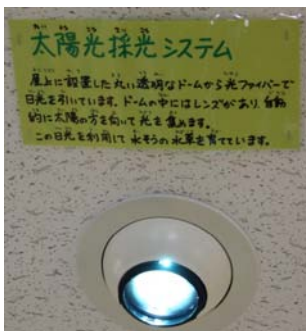
【めだかの池に太陽光を当て藻を育てます】