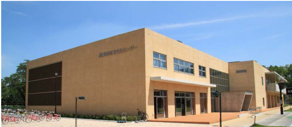
【左手の自転車と信号で交通ルールを学びます】