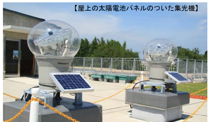
【屋上の太陽電池パネルのついた集光機】