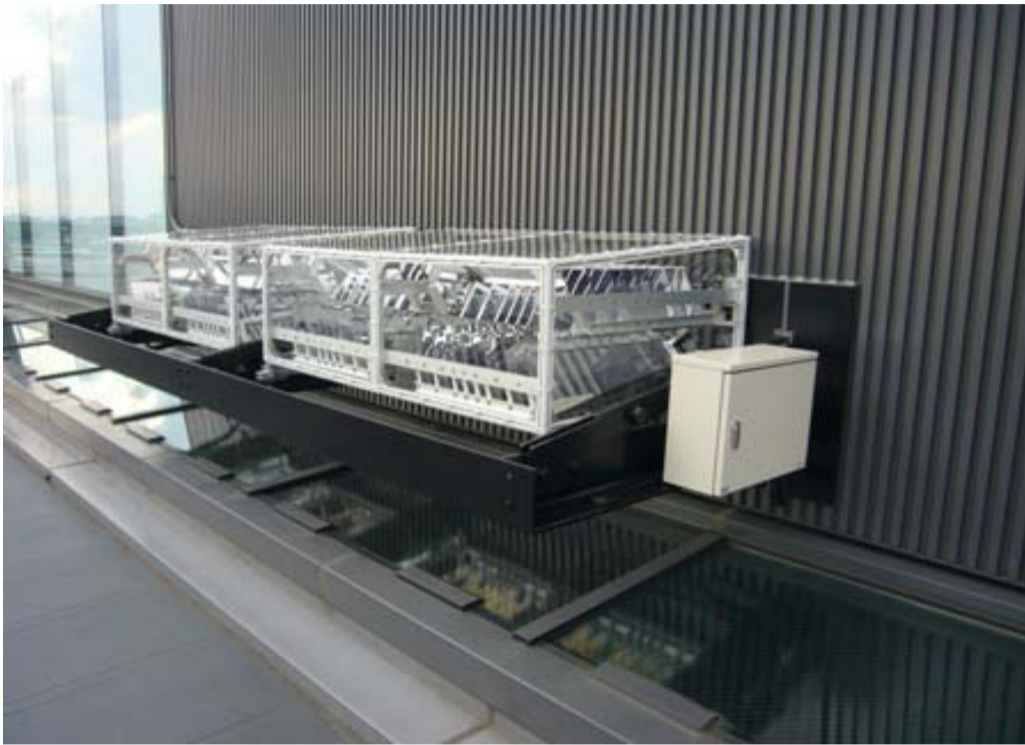
【特注仕様のダブルルーバー型ひまわり】