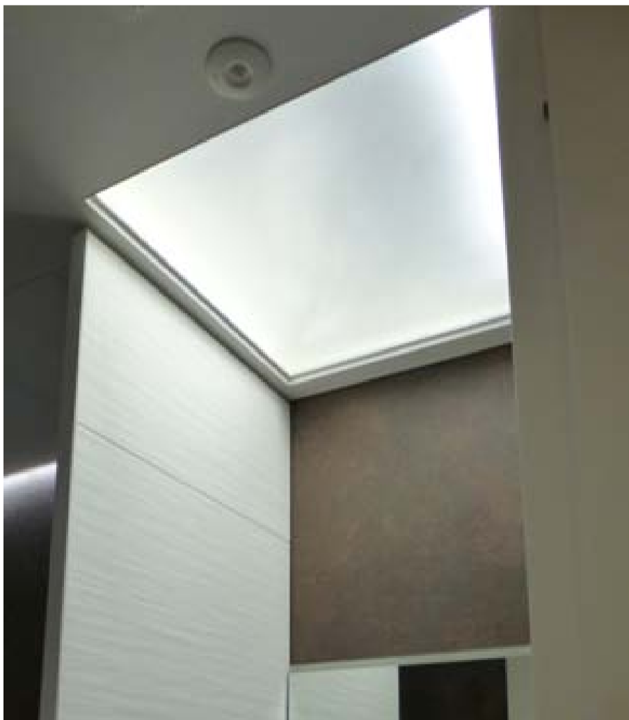
【洗面ルーム上の自然光導入の様子】