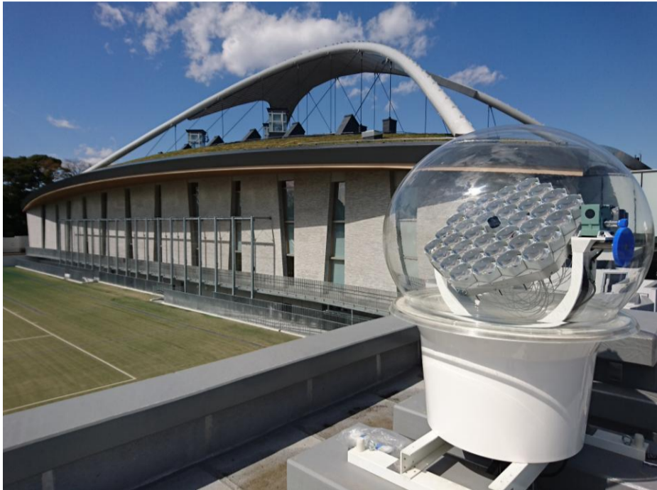
【ひまわり設置外観】